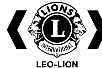
Firma a 1 colore - Nero