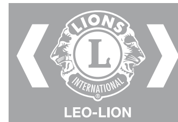
Firma de un solo color: blanco

Las dos firmas mostradas son las configuraciones principales. Son la opción preferida de firmas y nunca podrán ser recreadas ni rediseñadas. Utilice siempre el arte electrónico aprobado, disponible en nuestro sitio web.