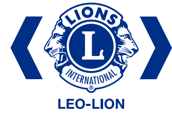
單色的身份標誌 — 藍色