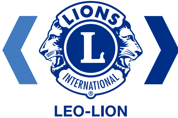
파란색 명판 3색 서명