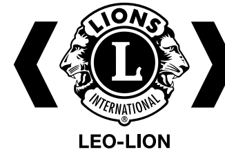
단색 서명 - 검정색